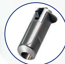
Option "Tout Tungstène"

Les protège-seringues Easyview se déclinent dans une gamme étendue et complète en dimensions et en blindage (de 2 à 7 mm de tungstène) afin de proposer aux utilisateurs une solution ergonomique et protectrice indispensable lors des préparations, transferts et injections de doses de radiopharmaceutiques toutes énergies pour les activités SPECT et PET . Quel que soit le radioélément considéré : 99m Tc, 111 In, 123 I, 177 Lu, 201 Tl, 131 I, 18 F, 68 Ga et la méthode d'administration requise : injection patient en direct ou par raccor-